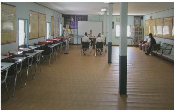
ห้องเรียนภาษาบาลี เรือนจำกลางบางขวาง

- ห้องเรียนตั้งอยู่ชั้นบนของอาคารห้องสมุดพร้อมปัญญา เรือนจำกลางบางขวาง แดน ๑๔ เป็นห้องเรียนภาษาบาลี โดยเฉพาะ สามารถรองรับนักเรียนได้โดยประมาณ ๖๐ คน ภายในห้องเรียนมีการจัดสื่อการเรียนการสอน บริเวณผนังห้องเรียนเพื่อสร้างบรรยากาศในการจัดการเรียนการสอน และมีห้องพระ สำหรับเรียนภาคปฏิบัติบริเวณด้านหน้าของห้องเรียน