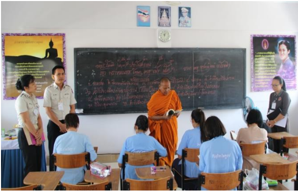
การเรียนการสอนภาษาบาลี

- ห้องเรียนตั้งอยู่ชั้นบนของอาคารเรียนทัศนสถาน หญิงกลาง เป็นห้องเรียนภาษาบาลี โดยเฉพาะ สามารถรองรับ นักเรียนได้โดยประมาณ ๕๐ คน ภายในห้องเรียน มีการจัดสื่อการ เรียนการสอนติดบริเวณผนังหน้าห้องเรียน และมีชั้นวางหนังสือ ข้างห้องเรียน เพื่อการศึกษาค้นคว้าของผู้เรียน